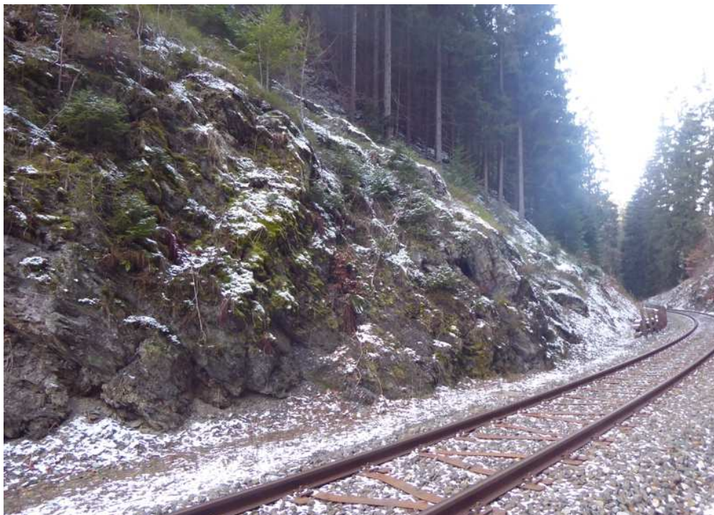
Levá část zářezu na začátku úseku. Po odstranění vegetace, očištění a odtěžení aku. prostoru bude zajištěna ocel. sítí 80 x 100 mm, částečně doplněnou o protierozní extrudovanou georohož.