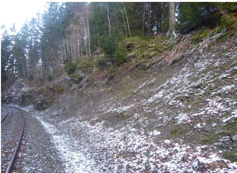
Pravá část zářezu na začátku úseku. Po odstranění vegetace, očištění a odtěžení aku. prostoru bude zajištěna ocel. sítí 80 x 100 mm, částečně doplněnou o protierozní extrud. georohož. Stávající vedení IS bude zachováno.