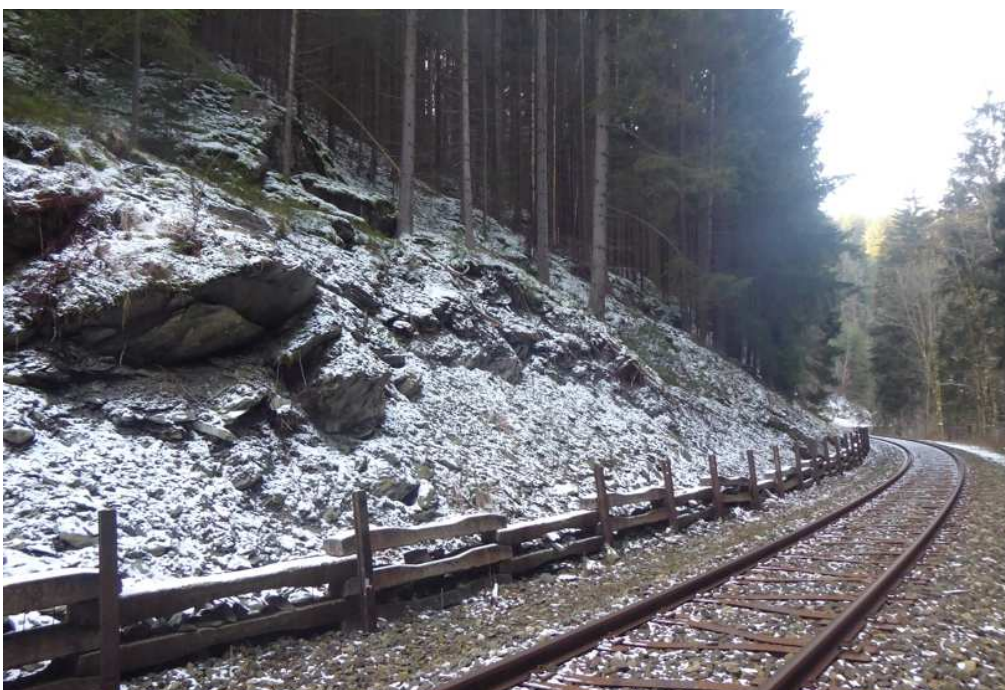
Levá část zářezu. Po očištění, lokálním odtěžení skal. převisů a odtěžení aku. prostoru bude v patě svahu, v geotechnikem vytypované linii, instalována pevná zábrana z prážců v. do 1,6 m. Stávající sloupy budou demontovány a bet. prážce budou doplněny dovezenými. Stávající vedení IS bude zachováno.