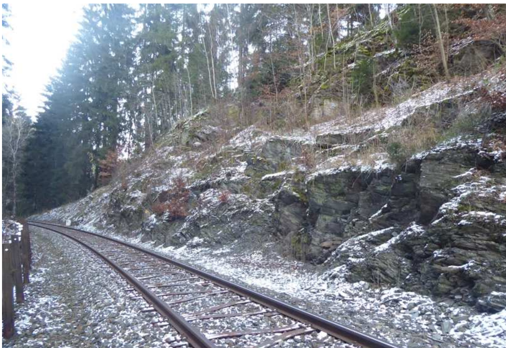
Pravá část zářezu. Po odstranění vegetace, očištění a odtěžení aku. prostoru bude na horní lavici, v geotechnikem vytypované linii, instalován ochranný plot v. do 2 m. Spodní část skal. svahu bude v geotechnikem vytypovaných partiích zajištěna lokálním kotvením.